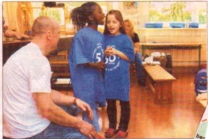
Ganz schön mutig – zu zweit vorsingen.