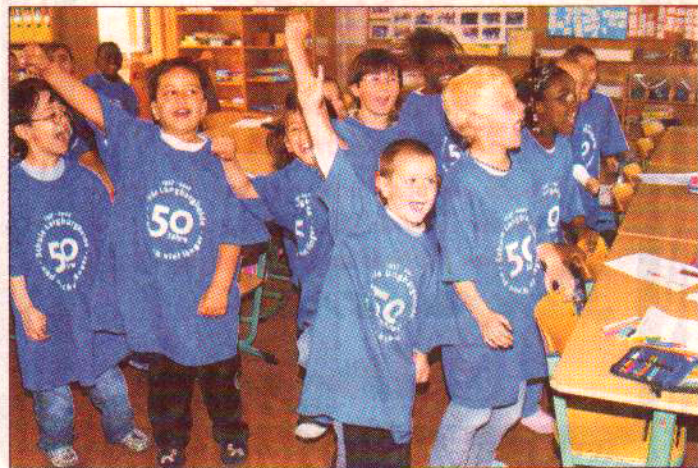
Ausgelassen sangen und tanzten die Kids.